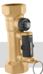
Serie 132 | Van ½" tot 2"