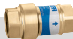
Serie 127 | ½" & ¾"