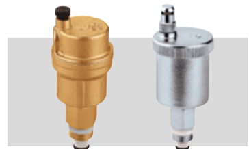
Art. 502730 | ¾"