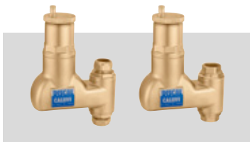
Art. 551902 | 22 Ø