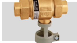
Art. 573401 | 1/2" Art. 573501 | 3/4"