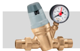
Art. 535051 | 3/4"