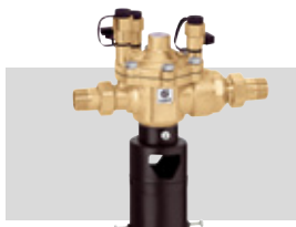
Art. 574050 | 3/4"