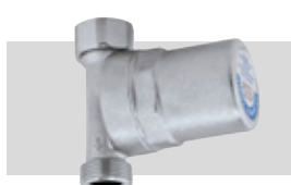
Art. 525150 KWA | 3/4"