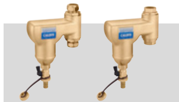
Art. 546902 | 22 Ø