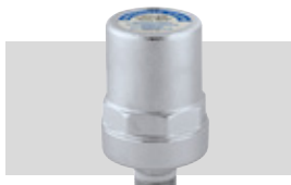
Art. 525040 KWA | 1/2"