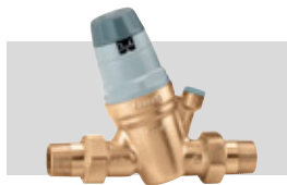
Art. 535050 | 3/4"